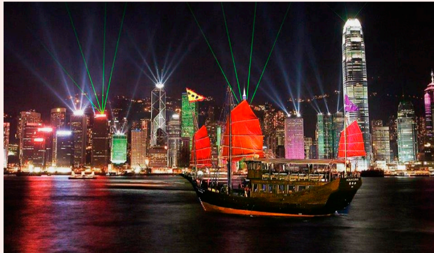
ビクトリアハーバー周遊クルーズ

ビクトリアハーバーには貸切専用のパーティー船も用意されている。バーカウンターやダンスフロア、バーベキューグリルなども用意されており、自由自在に船上空間を演出することができる。