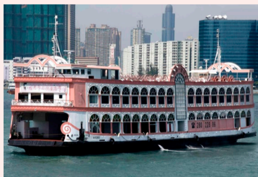
ハーバークルーズ・バウヒニア