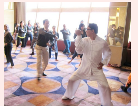
カンフー体験クラス