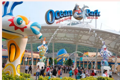
オーシャンパーク

パーク隣接地には「香港海洋公園マリオット・ホテル」と「フラトンオーシャンパークホテル香港」があり、宿泊も可能だ。