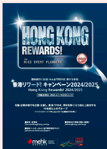
香港リワード! キャンペーン