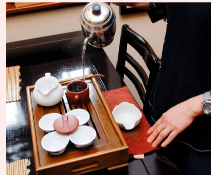
中国茶道体験クラス