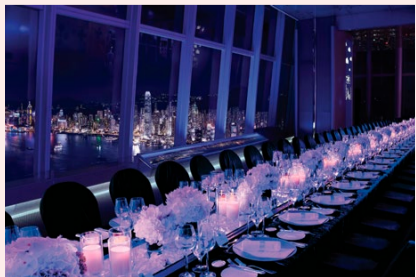
スカイ100香港展望台

スカイ100香港展望台は「インターナショナル・コマースセンター」の100階に位置。スペース全体や半分、4分の1部分を貸切することができる。利用方法は自由自在。また、好みの外部ケータリングサービスを利用可能だ。