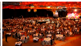
大型団体受入可能施設も