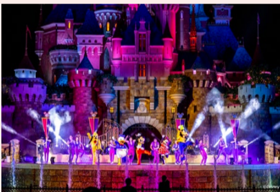
香港ディズニーランド・リゾート(写真はイメージです)