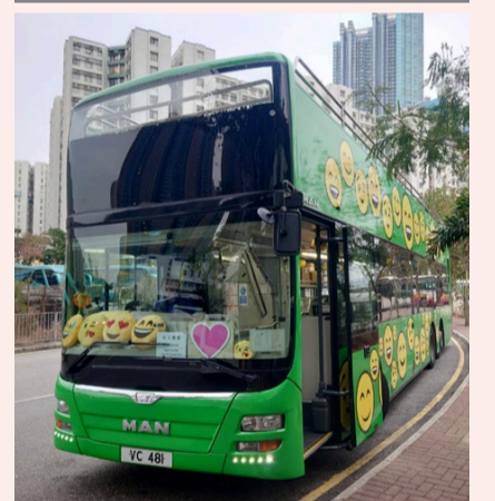
オープントップバス