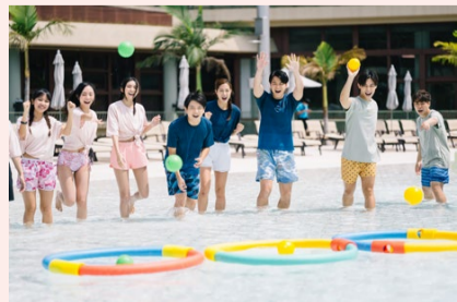
ウォーターワールド