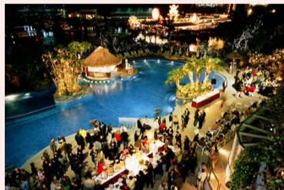
ザ・アバディーン・マリーナ・クラブ

香港島南部のアバディーン(香港仔)にある会員制クラブ。リゾート気分を満喫でき、セミナーや会議の開催も可能。パーティーメニューもアウトドアでのバーベキューから本格的なディナーまで、多彩な選択肢が用意されている。