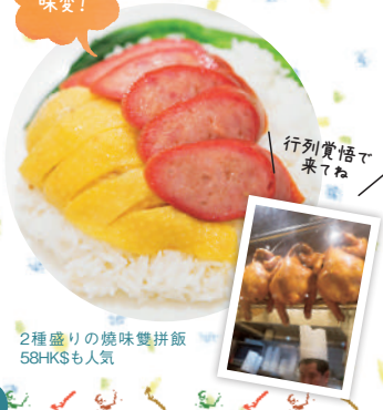
2種盛りりの焼味雙拼飯 58HK$も人気