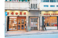
跑馬地行きトラムの終点から近い。店内には、芸能人のサインが。映画のロケにも使われた

朝から焼き上げる菠蘿包にバターを挟んだ金奖菠蘿包17HK$と香濃奶茶23HK$。菠蘿包の皮はサクサク、生地はふわふわ。ファンが多いのもうなずける。